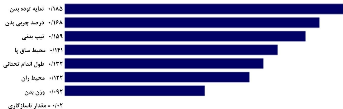
شکل ۵ - وزن زیرمعیارها در معیار شاخص‌های آنترپومتریکی برای استعدادیابی در فوتبال نابینایان

در بین شاخص‌های آنترپومتریکی، نمایه توده بدن با وزن (۰/۱۸۵) در اولویت اول قرار گرفت و پس از آن شاخص‌های درصد چربی بدن با وزن (۰/۱۶۸)، تیپ بدنی با وزن (۰/۱۵۹)، محیط ساق پا با وزن (۰/۱۴۱)، طول اندام تحتانی با وزن (۰/۱۳۲)، محیط ران با وزن (۰/۱۲۲) و وزن بدن با وزن (۰/۰۹۲) به ترتیب در اولویت‌های بعدی قرار گرفتند (شکل ۵).