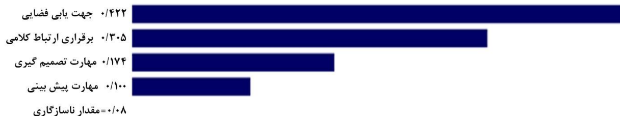
شکل ۲ - وزن زیرمعیارها در معیار مهارت‌های تاکتیکی برای استعدادیابی در فوتبال نابینایان

بر اساس نتایج، در بین مهارت‌های تاکتیکی، مهارت جهت‌یابی فضایی با وزن (۰/۴۲۲) به عنوان مهم‌ترین شاخص در این معیار انتخاب شد و پس از آن مهارت‌های برقراری ارتباط کلامی با وزن (۰/۳۰۵)، مهارت تصمیم‌گیری با وزن (۰/۱۷۴) و مهارت پیش‌بینی با وزن (۰/۱۰۰) به ترتیب در اولویت‌های بعدی قرار گرفتند (شکل ۲).