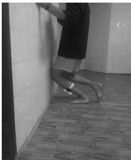
شکل ۱- نحوه اندازه‌گیری دامنه حرکتی مچ پا در حرکت لانج با استفاده از ژيروسکوپ

دستها را روی دیوار روبه‌رو قرار می‌داد و سپس، حرکت لانج را تا آستانه بلندشدن پاشنه از روی زمین انجام می‌داد. هم‌زمان زانوی آزمودنی باید با نوار عمودشده با نوار قرار گرفته روی زمین تماس پیدا می‌کرد. هر آزمودنی سه بار حرکت لانج را انجام می‌داد. میانگین سه بار اندازه‌گیری به‌عنوان دامنه حرکتی دورسی فلکشن محاسبه شد.