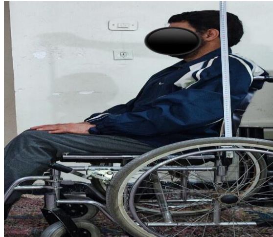
شکل ۱- طول قد نشسته افراد

برای اندازه‌گیری متغیرهای پژوهش از جمله دامنه حرکتی و قدرت عضلانی به ترتیب از دستگاه الکتروگونیا متر مدل موبی مد ۱ و دینامومتر دستی دیجیتال ۲ استفاده شد. همه ارزیابی‌ها یک ساعت پیش از شروع تمرینات ورزشکاران انجام شد و همچنین پیش از شروع آزمون‌گیری، آزمونگر ابزارها را کالیبره می‌کرد.