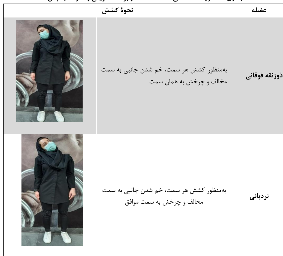
جدول ۱- تمرینات کششی استفاده‌شده در برنامه تمرینی و نحوه انجام آن

هشت هفته، هر هفته سه جلسه و هر جلسه ۴۵ دقیقه اجرا کردند. رژیم تمرینی شامل دو بخش بود: بخش اول به اجرای تمرینات کششی (کشش عضلات دوزنقه فوقانی، نردبانی، گوشه‌ای، کشش کپسول خلفی و قدامی) اختصاص داشت و بخش دوم شامل تمرینات قدرتی (بالا انداختن شانه‌ها، نشر از جلو، نشر از جانب، حرکت پروانه‌ی معکوس و گرفتن غبغب کنار دیوار) بود که با کش تراباند انجام می‌شد (جدول‌های شماره ۱ تا ۳). سرانجام در پایان هشت هفته تمرینات اصلاحی، بار دیگر تمام آزمودنی‌ها ارزیابی شدند و میزان درد و ناتوانی گردن و شانه و زاویه کرانیوورتربرال آن‌ها در پس‌آزمون اندازه‌گیری شد.