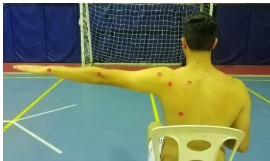
شکل ۳- ارزیابی دقت حس عمقی مفصل شانه در حرکت آبداکشن

پس از انجام آزمون‌های مرحله پیش‌آزمون، تقسیم‌بندی آزمودنی‌ها به صورت تصادفی انجام گرفت و آزمودنی‌های گروه تمرینی به اجرای هشت هفته تمرینات TRX پرداختند. در این مدت از تمامی آزمودنی‌های پژوهش خواسته شد تا تمرینات روتین رشته ورزشی خود را انجام دهند و از انجام تمریناتی پرهیز کنند که با هدف پیشگیری یا توان‌بخشی آسیب‌های کمربند شانه‌ای انجام می‌شود و بر نتایج پژوهش تأثیر می‌گذارد. برای رعایت اصل اضافه‌بار تمرین، سعی شد تا هر هفته با تغییر تعداد تکرار و زمان استراحت بین حرکات و همچنین ایجاد تنوع تمرینی و سخت‌تر کردن حرکات، اصول طراحی تمرین ۱ نیز رعایت شود (۸)؛ برای مثال، در تمرینات TRX با تغییر زاویه بدن نسبت به سطح زمین و یا کاهش محدوده سطح اتکا می‌توان شدت تمرین را دستکاری کرد. تمرینات استفاده‌شده در پژوهش حاضر براساس پژوهش سعادتیان و همکاران است که پیش از این اثرگذاری آن بر عملکرد عضلات کمربند شانه‌ای مشخص شده است (۸).