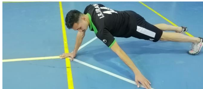
شکل ۲- نحوه اجرای آزمودن تعادل ۷ بالاتنه

برای ارزیابی دقت حس عمقی مفصل شانه در حرکت آبداکشن ۹۰ درجه، از روش تصویربرداری با دوربین دیجیتال استفاده شد؛ به این صورت که پس از انجام مارکرگذاری روی کمر بند شانه‌ای فرد، یک بار حرکت آبداکشن شانه در زاویه ۹۰ درجه بازسازی شد. پس از اینکه فرد بر روی صندلی نشست، از وی خواسته شد تا به صورت آزمایشی شانه خود را تا ۹۰ درجه آبداکشن بالا بیاورد. در این زمان، آزمونگر با فرمان «رسیدی»، از وی خواست تا این زاویه را به ذهنش بسپارد. سپس برای اجرای آزمون اصلی از آزمونگر خواسته شد تا حرکت ۹۰ درجه آبداکشن را بازسازی کند و زمانی که به زاویه هدف رسید، با گفتن «رسیدم»، آزمونگر بلافاصله از نمای خلفی عکس برداری می‌کرد. سپس تمامی عکس‌ها در نرم‌افزار کینووا ۱ بررسی شد تا میزان دقت حس عمقی مفصل شانه آزمودنی‌ها در حرکت آبداکشن تعیین شود. شایان ذکر است، برای تأکید بر ارزیابی دقیق حس عمقی، حرکت مذکور در حالت «چشم‌بسته» انجام شد. میانگین سه اجرای صحیح فرد به‌عنوان زاویه بازسازی دقت حس عمقی مفصل شانه در نظر گرفته شد. پایایی این روش از ۰/۸۷ تا ۰/۹۶ گزارش شده است (۱۶، ۱۵) (شکل ۳).