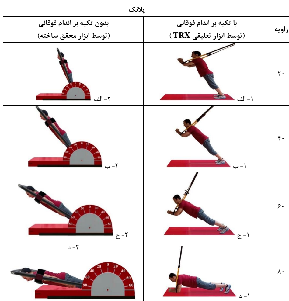
شکل ۲- آزمون‌های تحقیق

برای ثبت فعالیت الکتریکی عضلات از دستگاه بیومانیاتور ۱۶ کاناله ME 6000-T16 ساخت کشور فنلاند با نرخ نمونه‌برداری ۱۰۰۰ هرتز استفاده شد. عضلات منتخب ثبات مرکزی در مطالعه حاضر شامل راست شکمی، مایل خارجی، مالتی‌فیدوس، راست‌کننده ستون فقرات کمری و راست رانی بودند (۲۳، ۶). قبل از چسباندن الکترودها، پوست از مو و چربی پاک‌سازی شد. ثبت فعالیت الکتریکی