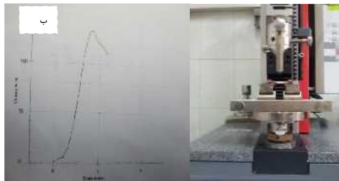
شکل ۲- الف. اندازه‌گیری پارامترهای بیومکانیکی به وسیله دستگاه نیروی خمشی سه‌نقطه‌ای. شکل ۲- ب. نمونه‌ای از منحنی تنش - کرنش.